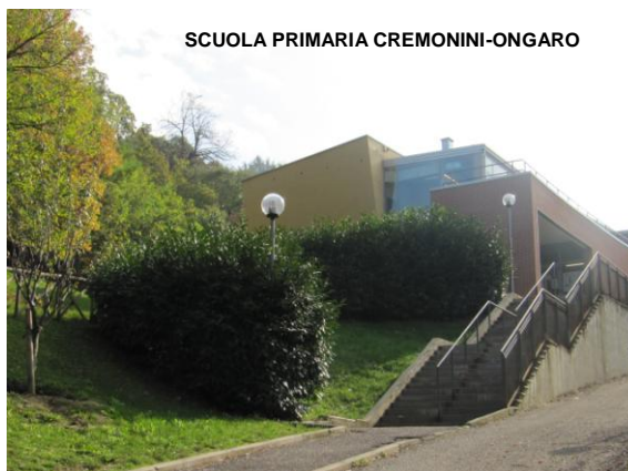
SCUOLA PRIMARIA CREMONINI-ONGARO