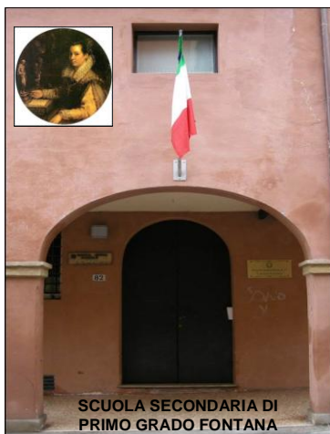
SCUOLA SECONDARIA DI PRIMO GRADO FONTANA