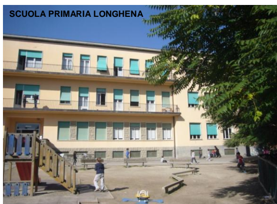
SCUOLA PRIMARIA LONGHENA