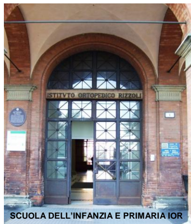
SCUOLA DELL'INFANZIA E PRIMARIA IOR

Il presente documento, adottato nella seduta del C.d.I. del 10 novembre 2014 con Delibera n. 42